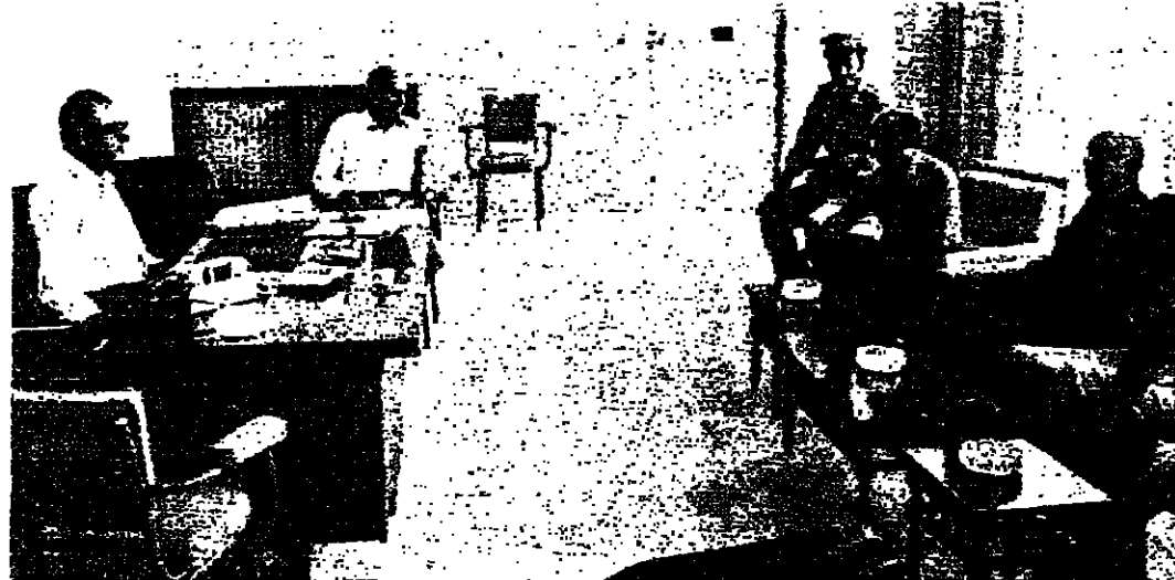
الحافظ رياض اثناء اجتماعه بالمعيد بطيوس

دعا اصحاب الدواجن في القطاع المسؤولين الى اعطائهم سلفات بنك الإنماء الصناعي و او منحهم مبلغ مساوية للمبالغ التي صرفت لاصحاب تعاونيات الدواجن وتمهيدا بتفسيح سلفات المصرف . جاء ذلك في برقية وجهها هؤلاء الى رئيس الجمهورية ورئيس الحكومة ووزير الاسكان والتعاونيات قالوا فيها ان الدولة خصصت مبلغ عشرة ملايين ليرة لبنانية لتجديد ومساعدة قطاع الدواجن في القطاع ، ومهدت الى التعاونية مهمة توزيع المساعدات على مقري القطاع الدواجن في المنطقة . تدعينا بطلبات التساؤل وقرض ، فرفضتها التعاونية بحجة اننا غير متسبين اليها سابقا . ولا كما تدعي بضرورة اصدار مائة يمكن التفتت منها بالكتف الحسي ، ويتقرر الدرك في حينه ، ولا كما من البنانيين وذلك سبب باقاة من اصحاب الدواجن غير التسبين للتعاونية في حينه بسبب الظروف ، وكما حاليا غير قادرين على تسبين تعاونية قبل اعادة بناء مزارعنا ، ووجدنا اننا لا نلبي الا في اوضاع حقوقنا كبنانيين ، وحرماننا من مساعدة الدولة الامم . نحن من ذلك المزارع المتوسطة اصحابها وعائلاتهم يتجاوز عددهم الالف . ولا مجال لتأمين ميسرنا الا من مداننا ، نرجو اعتماد بنك الإنماء الصناعي لندرس طلبنا واوضاعنا ونسألنا حاجتنا من ضمن المبالغ المخصصة لهذه الغاية ، او اعطائنا مبلغا مساويا للمبلغ المصروف للتعاونية ، فساهمات تقدمها للمصرف نسترددها لكم ونرجو اتصالنا والاستجابة لطلبنا المحق .